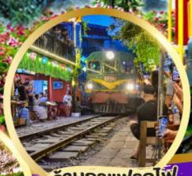
ร้านกาแฟรถไฟ