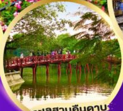
ทะเลสาบคินคาบ