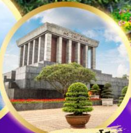
สุสานลุงโฮ