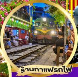
ร้านกาแฟรถไฟ