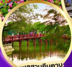
ทะเลสาบคินคาบ