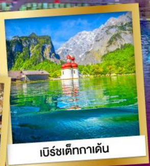
เบิร์ชเต็กกาเดิน