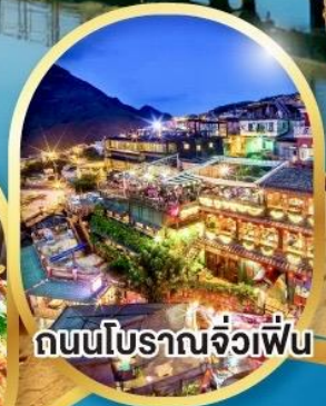
ถนนโบราณจิวเฟิ่น