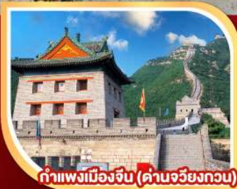
กำแพงเมืองจีน (ด่านจวิรงกวน)