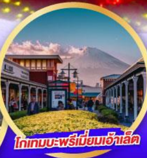
โทกามะ-พรีเมียมเอ้าเล็ท