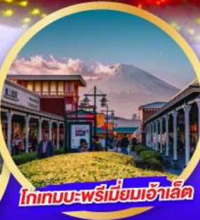
โกเทมบะ-พรีเมียมเอ้าเล็ท