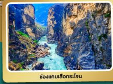
ช่องแคบเลิกระใจ