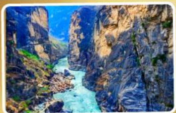
ช่องแคบเลิกระใจ