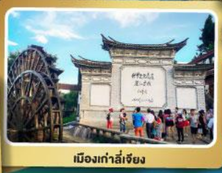
เมืองท่าลี่เจียง