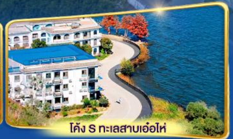
โค้ง S ทะเลสาบเอ๋อไห่