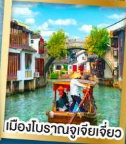
เมืองโบราณซูโจวเจียเจียว