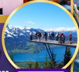
ยอดเขา ฮาร์เตอร์คูลุม