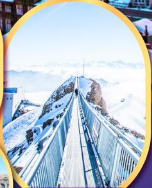
ยอดเขา กลาเซียร์ 3000