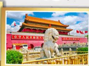
จัตุรัสเทียนอันเหมิน