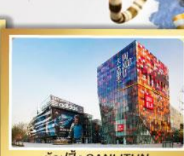
ช้อปปิ้ง SANLITUN