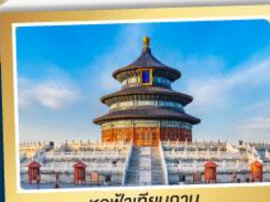
หอฟ้าเทียนถาน

จ่ายราคาเดียว..เที่ยวเต็มอิ่ม ..ไม่ลงร้านช้อปปิ้ง