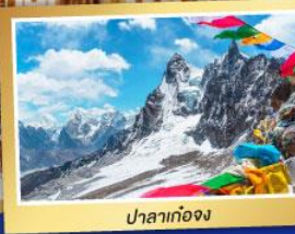
ปาลาก่อจง