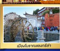
เมืองโบราณแชงกรี่ล่า