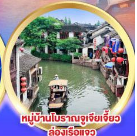
หมู่บ้านโบราณจูเจียเจี้ยว ล่องเรือแจว