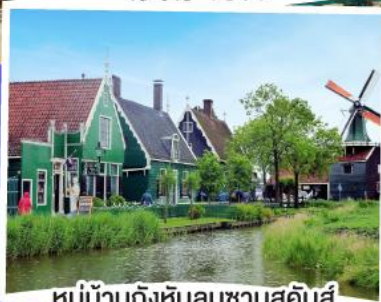
หมู่บ้านกังหันลมชาวนสคินส์