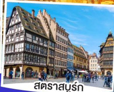
สตราสบูร์ก