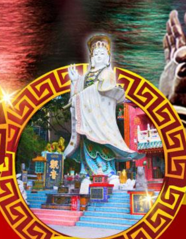
เจ้าแม่กวนอิม ทาศรีพิศลย์