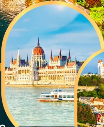
ส่องเรือแม่น้ำดานูบ