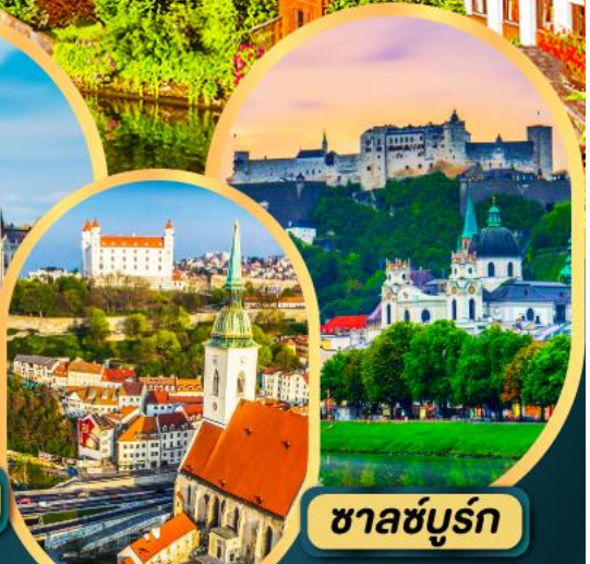
ชาลซ์บวร์ก