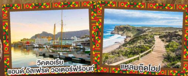
วิกตอเรีย แอนดฺ อัลเฟรด วอเตอร์ฟรอนต์