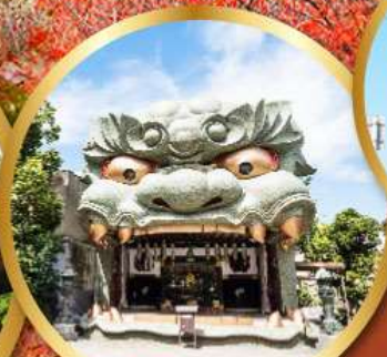
ศาลเจ้านิมบะ-ยาซากะ