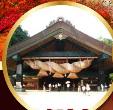
ศาลเจ้าอิชิโมะ-โทเซะ