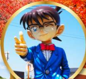
โคนันทาวน์