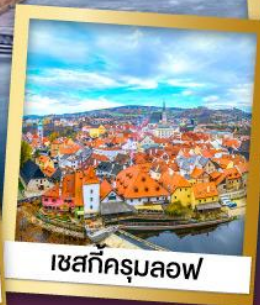
เซสท์ครุมลอฟ